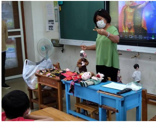
懸絲偶表驗藝術課程