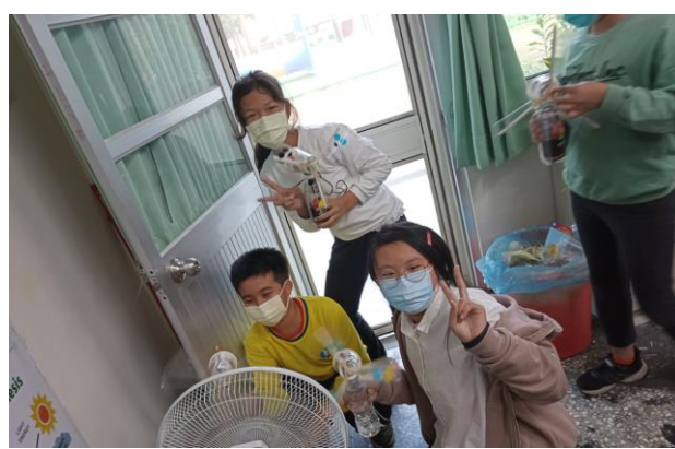
課後科學營隊活動剪影