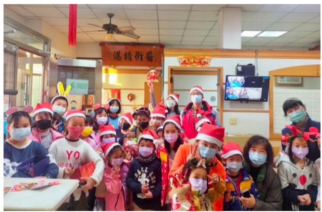
配合節慶活動—聖誕踩街