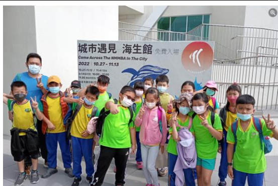
深具教育意義的戶外教育課程