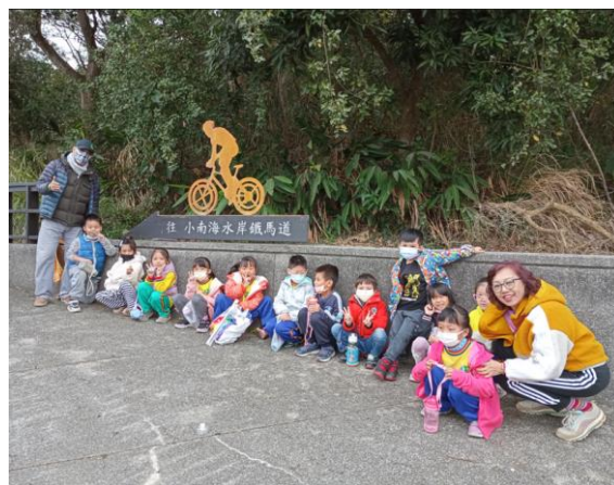
小南海成為學校的教學場域之一