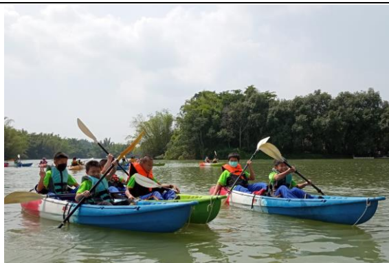
山野教育體驗課程