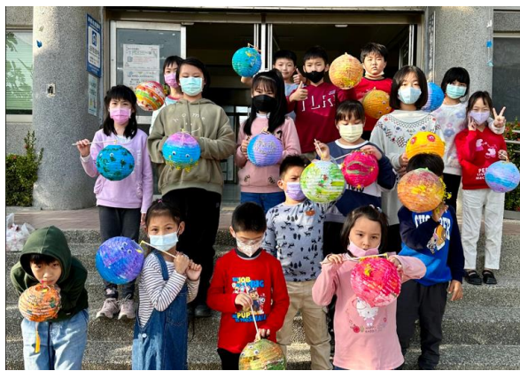
配合節慶活動-元宵提燈