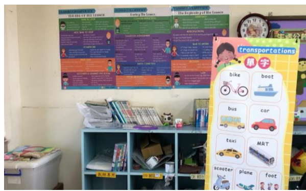
教室雙語情境布置