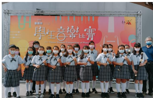
參加本市音樂比賽，屢獲佳績