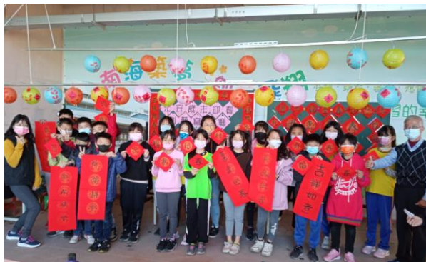
書法教育，結合節慶寫春聯