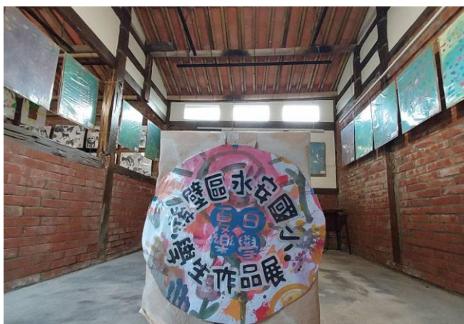
至菁寮老街俗女村進行動靜態成果展演