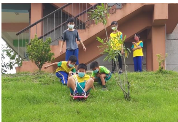
多元探索課程剪影