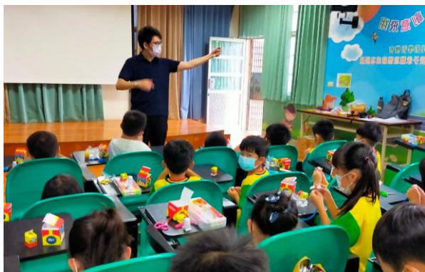
低年級科探索體驗課程

著重跨領域學習、動手實作、落實生活應用、解決問題、五感學習等，激發學童潛能與創意。低年級規劃科學探索體驗課程，建立科學、物理等基本概念，培養多元探索與實作的學習經驗。中、高年級則推動邏輯思維機器人課程，引導學童透過程式撰寫，驅動機器人，培養思考推理與問題解決習慣與能力。