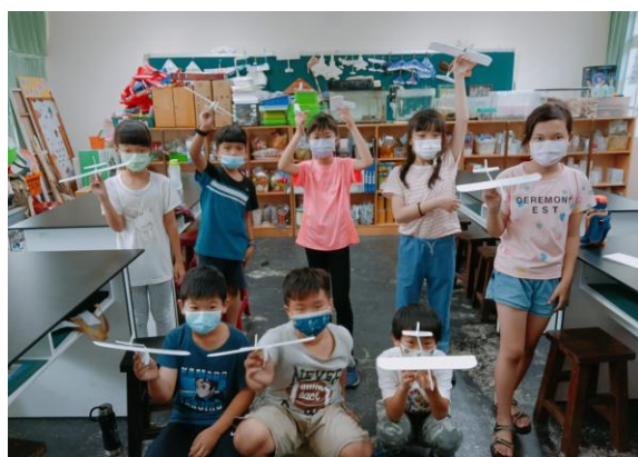
課後科學營隊活動剪影