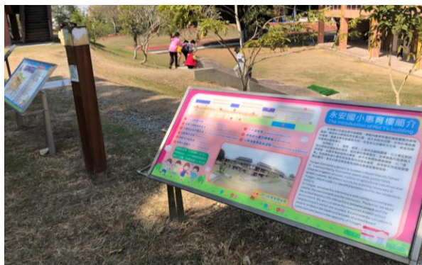
校園環境標誌完成雙語化