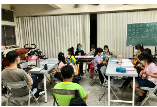
社區才藝課程—烏克莉莉演奏