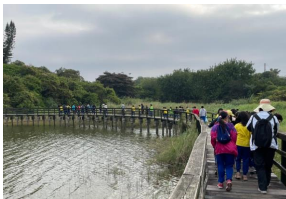
學校本位家鄉踏查課程-實地踏查