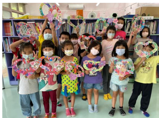
課後照顧服務班美勞創作