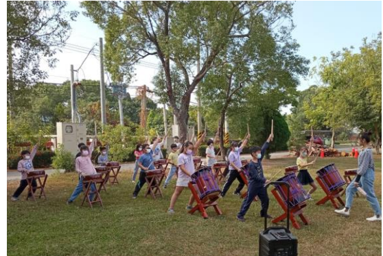
太鼓團隊合奏課程