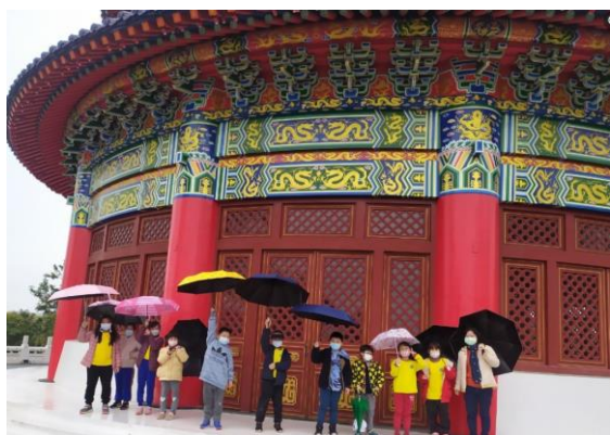
學校本位家鄉踏查課程-實地踏查