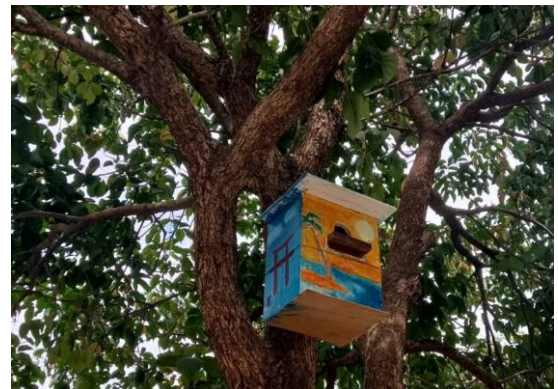
藝術創作結合環境教育，彩繪”鳥屋”

2. 孩子的表現需要有舞台給予呈現，永安國小積極規劃與提供展現的機會，讓每個孩子都有展能的機會，激發學童的自信心與學習動機。