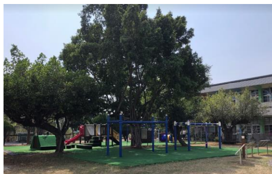
安全友善的校園設施