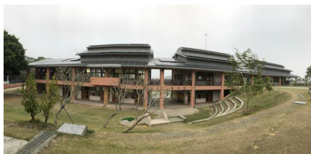
榮獲建築園冶獎之校舍建築