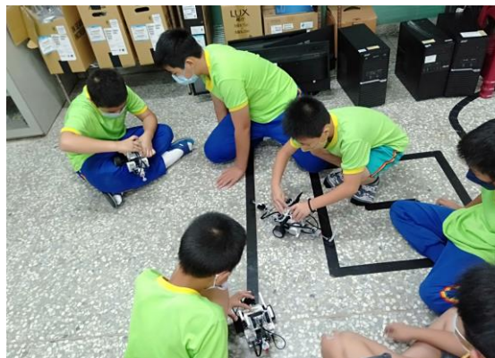
中高年級邏輯思維機器人課程