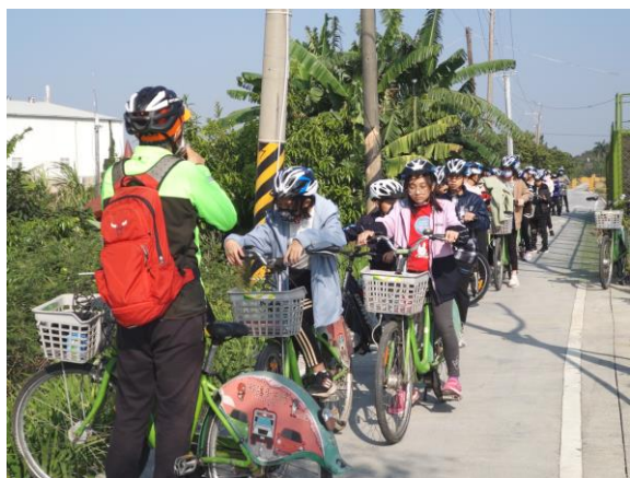
鄰近的嘉南大圳單車道也是學習的場所