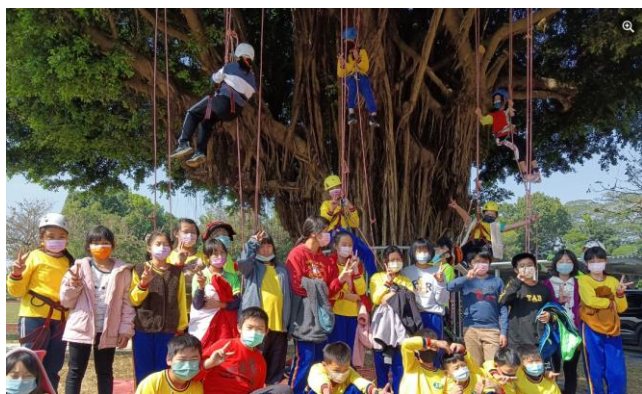
校園攀樹體驗課程