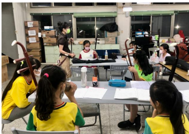
社區才藝課程--二胡演奏

學校位於社區當中，學童更是在社區中生活，學校與社區是密不可分的生命共同體。永安國小與社區建立起教育合夥人之夥伴關係，其中在地之佳田社區關懷協會，提供永安國小弱勢及有需要的學童，於課後與假期時間，規畫課業指導與多元的照顧與服務，實現由學校與社區共同教養孩童的理想目標。