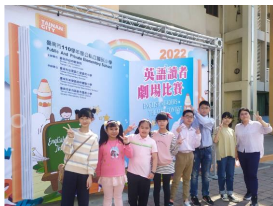
學童參加英語讀者劇場比賽，屢獲佳績