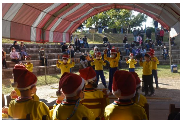
辦理成果發表會，邀請家長見證學童成長