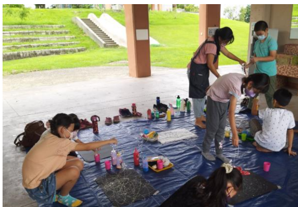
多元素材藝術創作