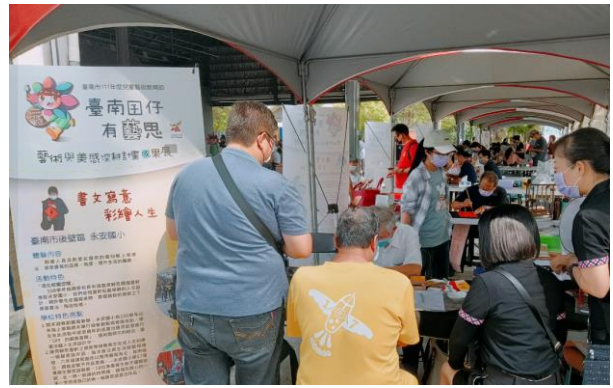
永安國小獲邀公開展示藝文教育成果