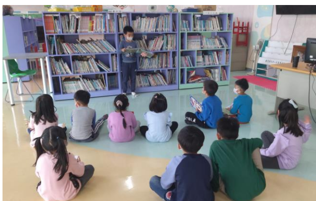
課後照顧服務班閱讀活動

針對低年級與中年級學童，永安國小開辦課後照顧服務班，配合全校放學時間，照顧至下午四點。課後照顧班除指導學童作業外，並規劃多元學習活動，例如閱讀指導、兒童美術、益智桌遊等，豐富學童課後學習資源。